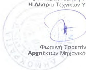
Φωτεινή Τσακπίνου Αρχιπέκτων Μηχανικός Π.Ε. / Β'

Θεωρήθηκε Αγία Παρασκευή 4 / 05 / 2015 Η Δ/τρια Τεχνικών Υπηρεσιών