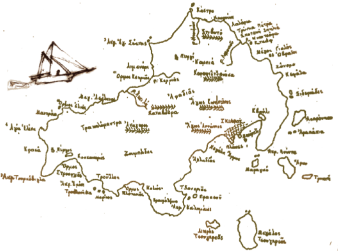
Το караβάκι είναι παιδικό σχέδιο του Αλέξανδρου Παπαδιαμάντη Εξώφυλλο: Δημήτρης Ευσταθιάδης, Ξυλογραφία, 1943